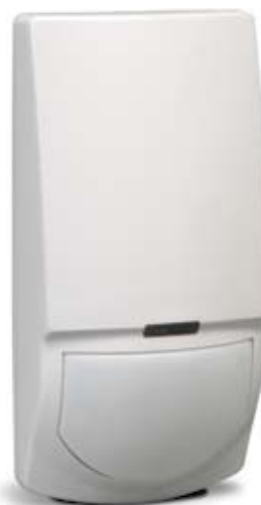
FW - SWAN